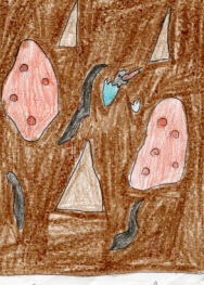
Para algo iluminado en la cueva