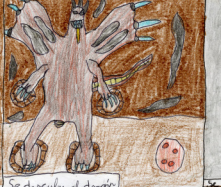
Se despierta al dragon