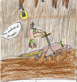
Nos matado al dragon