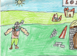
El otro se fue a su pueblo y le era el destruido