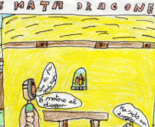
Es malo al dragon