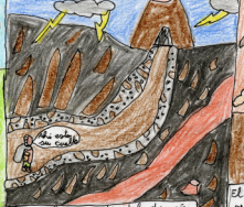
Me odio su castillo