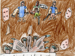
Vamos a la sala del dragon