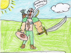
Quiero un arca, oro, flechas y escudo