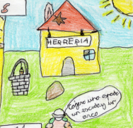
Como uno es un asesino un arca