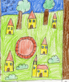
El pueblo se reconstruye