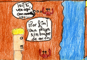
Pero están en la isla imposible y...