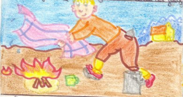
Si el incendio es en el bosque apaga las llamas con un trapo mojado.