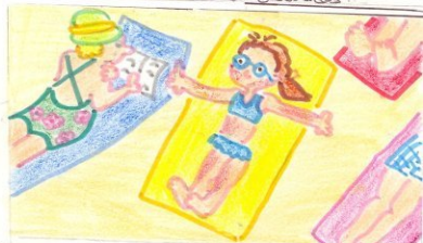
No se debe tomar el sol en exceso.