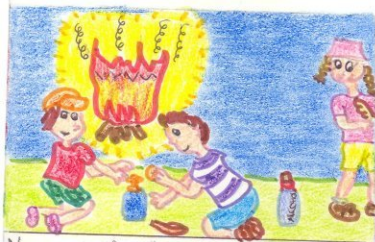
No manejas líquidos inflamables cerca del fuego No se debe fumar en la cama.